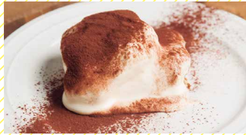
ティラミス 550 Tiramisu

香り高いエスプレッソがしみこんだ生地に 特製マスカルポーネクリームを重ねた、自信作!