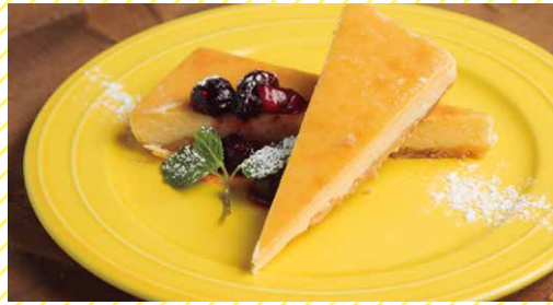
バイクドチーズケーキ 550 Baked Cheese Cake

しっとりモチモチとしたショコラケーキ。 たっぷりのクリームとチョコレートソースで!