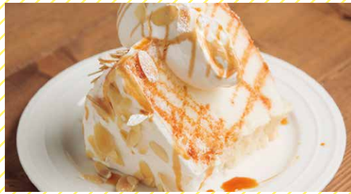
エンゼルフードケーキ バニラキャラメル 500 Angel Food Cake Vanilla Caramel

バニラ風味のしっとりモチモチのケーキ。 キャラメルソースが相性抜群の美味しさです!