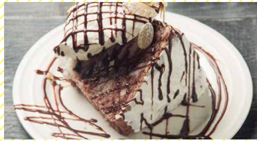
エンゼルフードケーキ ショコラ 500 Angel Food Cake Vanilla Chocolate

バニラ風味のしっとりモチモチのケーキ。 キャラメルソースが相性抜群の美味しさです!