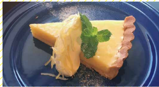
レモンタルト 550 Lemon Tart