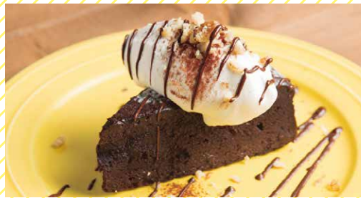
ガトーショコラ 550 Gâteau au chocolat

香り高いエスプレッソがしみこんだ生地に 特製マスカルポーネクリームを重ねた、自信作!